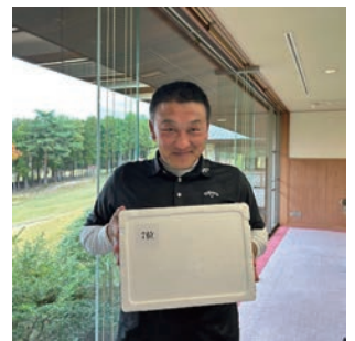
地区大会 柿安シティホール 2025.11.8