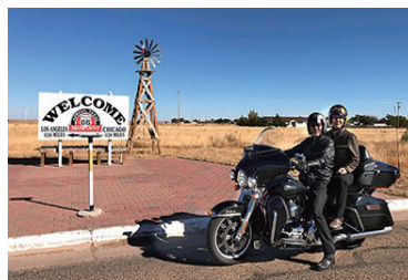
2016.10 アメリカ R66 中間点エイドリアン