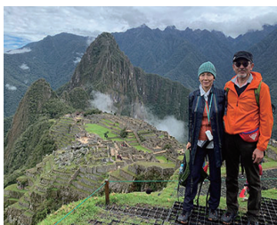
2018.11 ペルー マチュピチュ

歴史、光、そして食の全てが詰まった松本市での初めての旅は、忘れられない特別な思い出になりました。