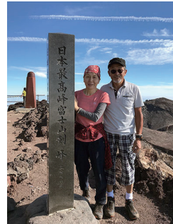
2018.7 富士山 頂剣ヶ峰