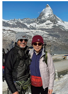
2023.6 スイス ツェルマツト