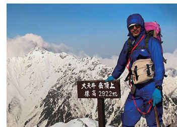
48歳 雪山ソロ登山 北アルプス