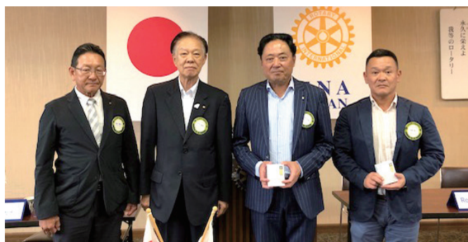
新旧会長・幹事 バッジ交換