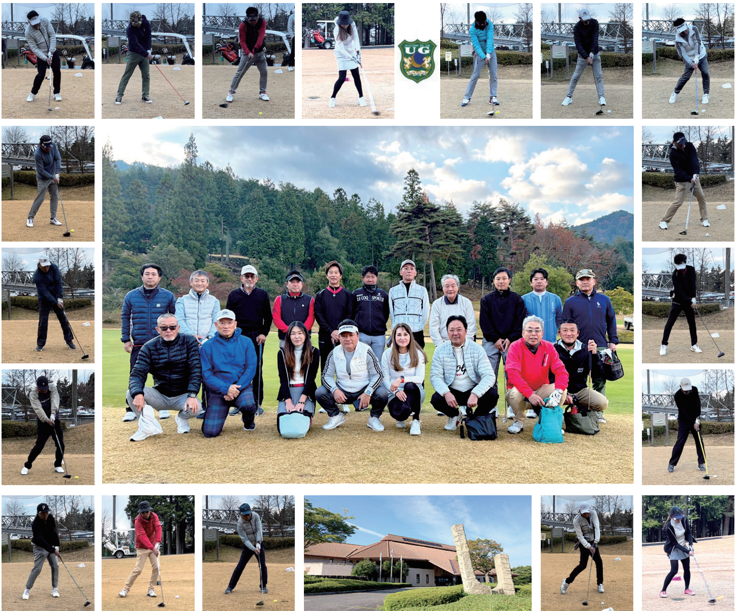
2023-24 愛知長久手 RC・恵那 RC 合同夜間例会 (11 月祝福) メゾンドウジアルダン 2023.11.28